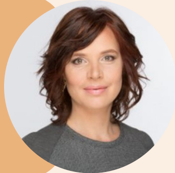
Veronika Remišová Vicepremiérka a ministerka investícií, regionálneho rozvoja a informatizácie SR

„Schválenie Plánu spravodlivej transformácie územia považujem za obrovský úspech, ktorý je výsledkom skvelej spolupráce s regiónmi, súkromným sektorom, mimovládnyimi organizáciami, zamestnávateľmi, ako aj členmi Európskej komisie a ostatnými rezortmi. Podarilo sa nám zabezpečiť na nasledujúcich sedem rokov zdroje, ktoré nám pomôžu zamerať sa na riešenie dôsledkov ukončenia ťažby a spaľovania domáceho uhlia na Slovensku, ako aj dekarbonizácie priemyslu spravodlivo, s ohľadom na potreby ľudí žijúcich v transformujúcich sa regiónoch.“