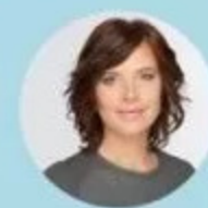
Veronika Remišová Vicepremiérka a ministerka investícií, regionálneho rozvoja a informatizácie SR

S veľkým potešením si Vám dovoľujem predstaviť nový spôsob pravidelného informovania regiónov o vývoji a aktuálnom dianí v rámci Fondu na spravodlivú transformáciu (FST). Efektívna a transparentná komunikácia, rovnako ako včasné a čo najefektívnejšie preinvestovanie prostriedkov z FST sú prioritami nášho ministerstva na ceste za zelenou tranzíciou dotknutých regiónov.